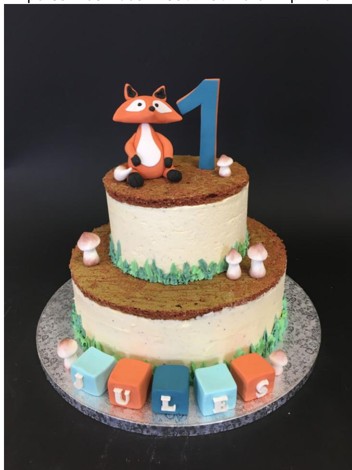
Framboisier 35 personnes avec Décor en Pâte à sucre

SARL Une Fille en Cuisine 3 rue de Bruxelles – ZAC de la Vallée Barrey 14120 MONDEVILLE 791 833 601 RCS CAEN